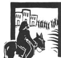
Domenica delle Palme

ORE 10.15: BENEDIZIONE DELL'ULIVO IN PIAZZA ARNALDI Seguirà la messa in chiesa.